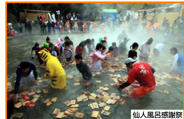
Kawayu Onsen Sennin-buro River Bath (Kawayu Onsen)