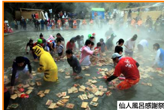
Kawayu Onsen Sennin-buro River Bath (Kawayu Onsen)