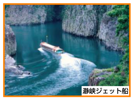
Dorokyo Jet-boat (Shiko)